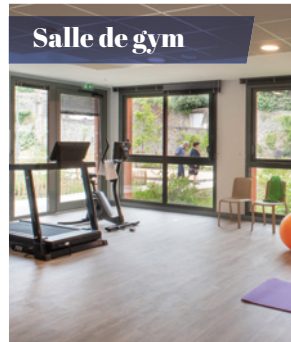
Salle de gym